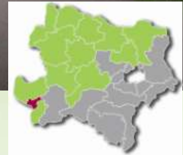
Reihenhausanlage Eigentum | Waidhofen/Ybbs | derzeit im Bau