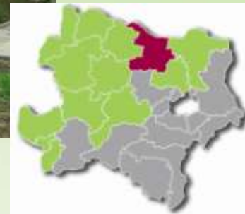
Reihenhausanlage | Aberndorf