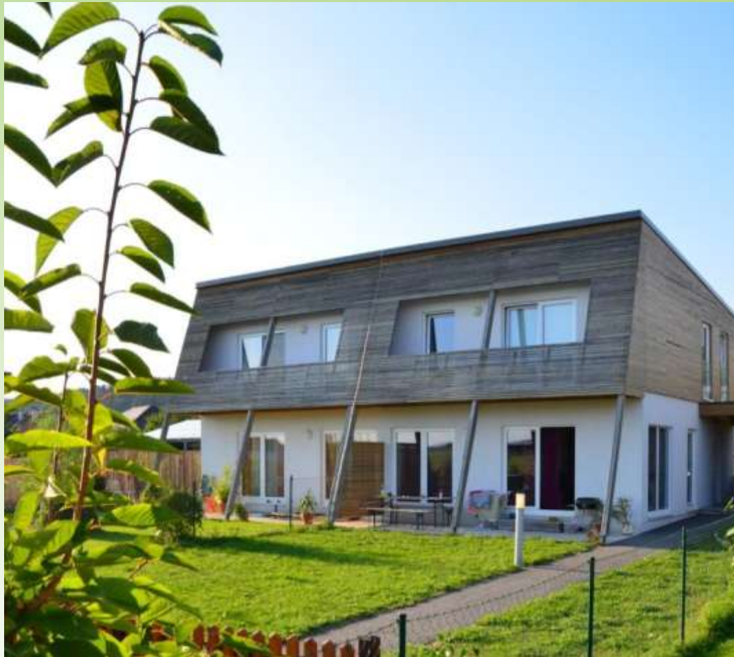
Reihenhausanlage | Brunn an der Wild

WAV | Referenzprojekte | Förderung / Kosten | Wohnzuschuss/ Beispiel | und nun?