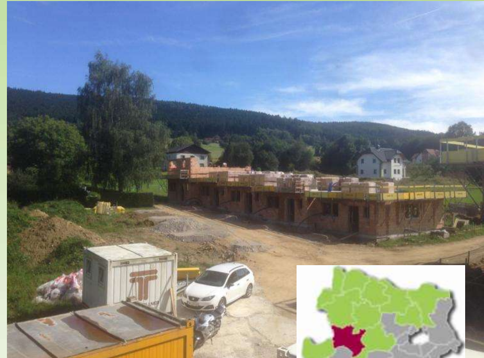
Reihen- und Wohnhausanlage | Altenmarkt | im Bau