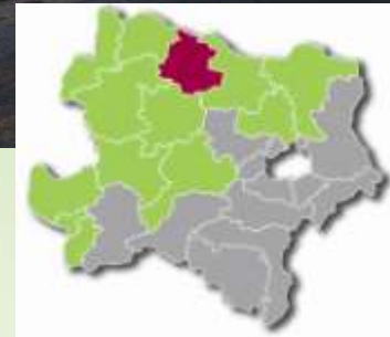
Reihenhäuser | Sigmundsherberg